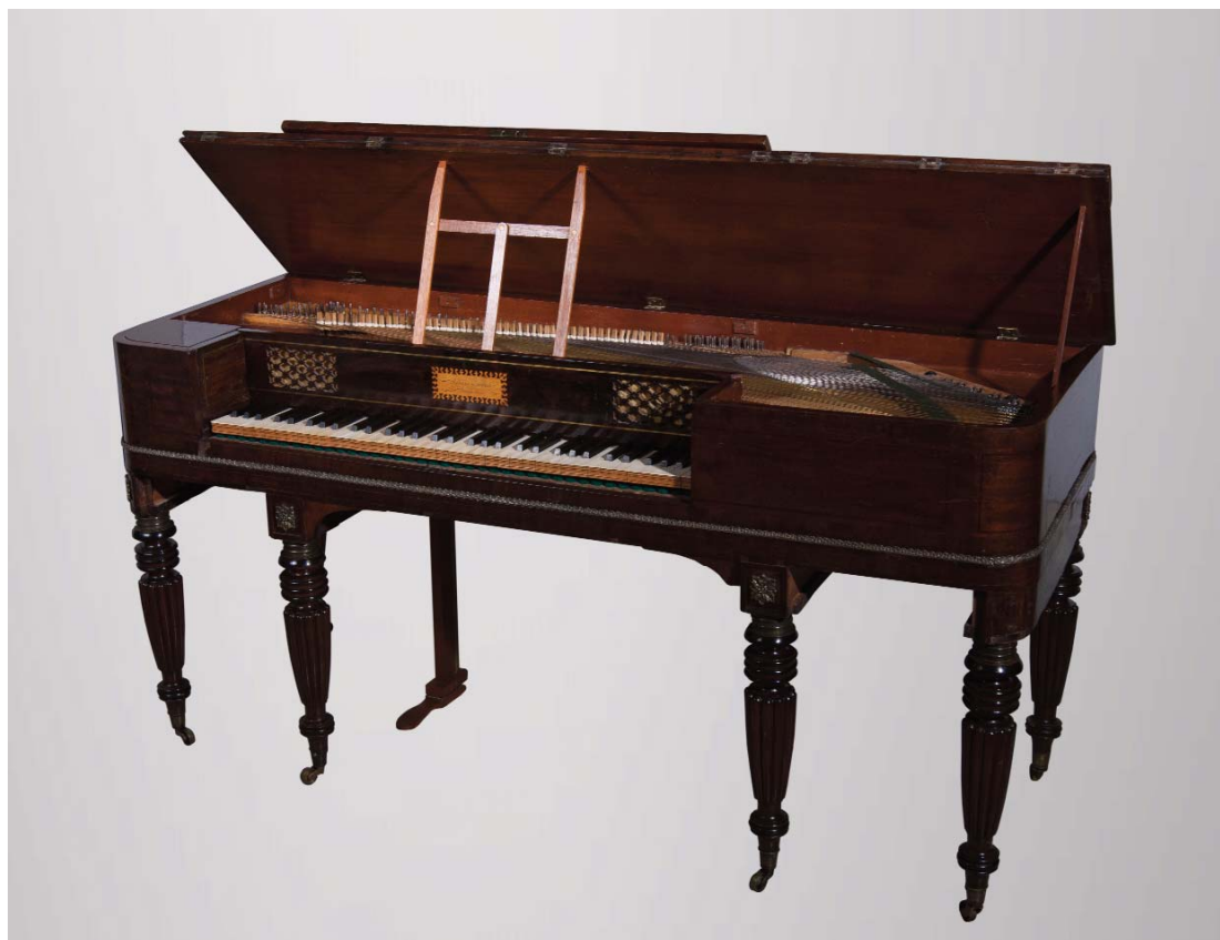
Pianoforte perteneciente a Mariquita Sánchez de Thompson en el que se ejecutó por primera vez el Himno Nacional, Museo Histórico Nacional, Argentina.

El día 8 de marzo de cada año conmemoramos la lucha de las mujeres por la igualdad social y política.