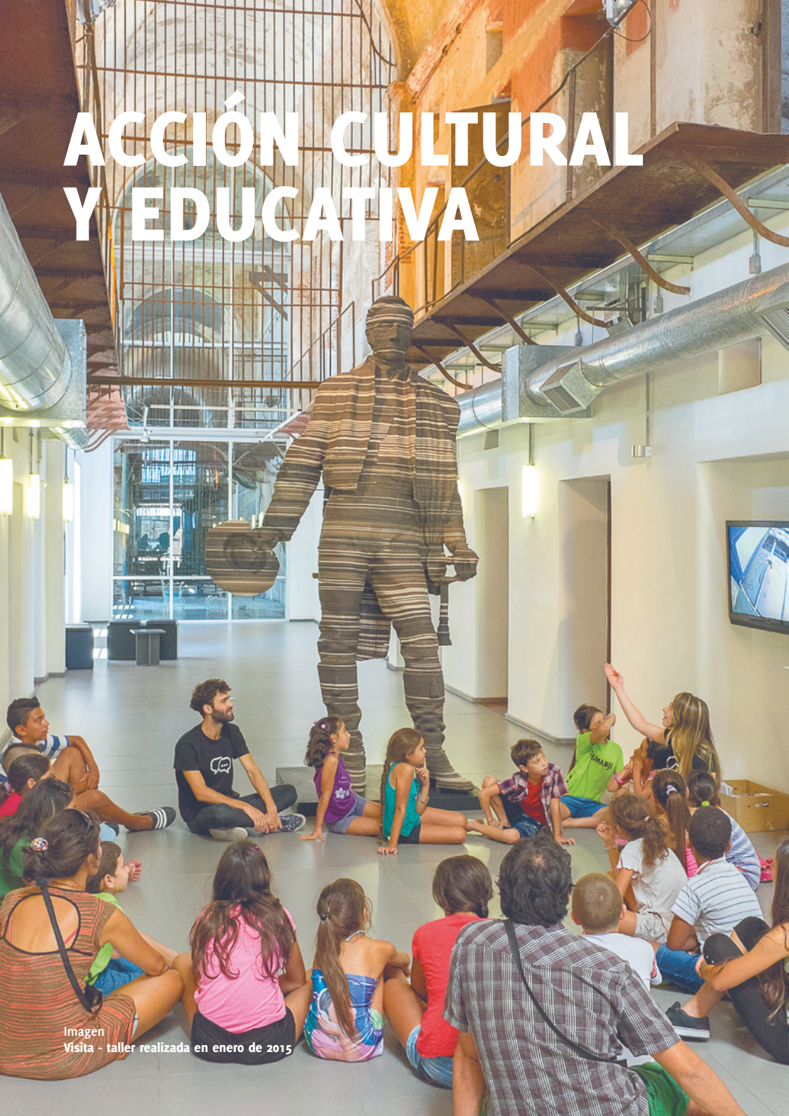
Imagen Visita - taller realizada en enero de 2015