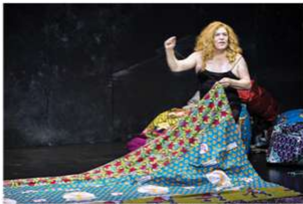
Escena de El Retrato de Raül que se presenta en el Festival Internacional de Artes Escénicas del Uruguay (FIDAE).

Flasheo al 15 hasta el 26 de agosto en recomendamos la revista online del Festival