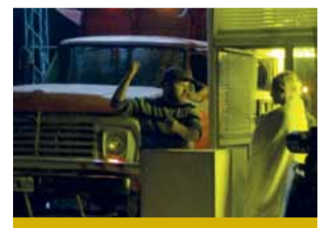
Una noche sin luna

Dir: German Tejera Prod: Julian Goyoaga y Juan Maristany Contact: Raindogs Films juliangoyoaga@gmail.com www.raindogs.com.