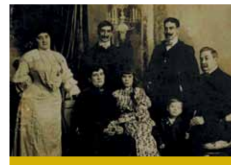
El padre de Gardel