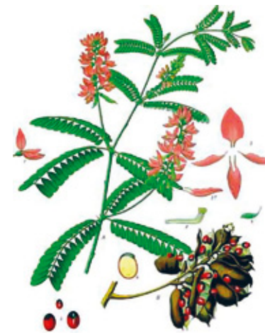
Abrus precatorius L.