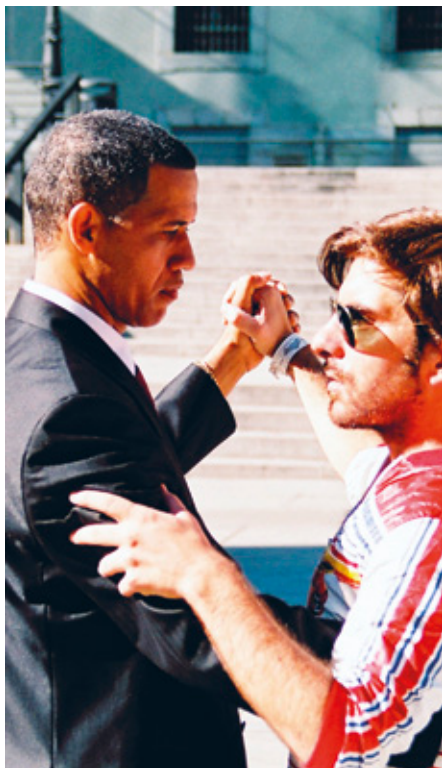
Video - Tango con Obama