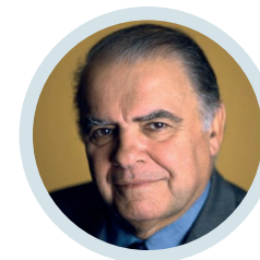
Enrique Iglesias Invitado Especial