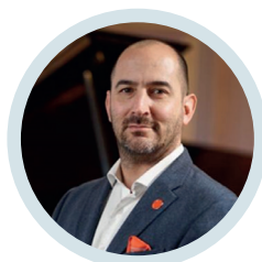
Felipe Buitrago Exministro de Cultura