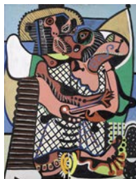
PABLO PICASSO Le Baiser Juan-les-Pins, été 1925 Huile sur toile 130,5 x 97,7 cm © Succession Picasso 2019 Musée Picasso Paris