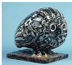
PABLO PICASSO Cérámique Chouette Vallauris, 30 décembre 1949 Chouette Terre blanche: pièce tournée. Décor aux engobes, émail blanc et incisions, le tout sous couverte au pinceau 19 x 18 x 22 cm © Succession Picasso 2019 Musée Picasso Paris