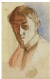
PABLO PICASSO Autoretrat Barcelona, 1900 20,7 x 13,1 cm Museu Picasso de Barcelona

Picasso coincide de nuevo con Torres-García frecuentando los ambientes bohemios de la ciudad, como la taberna Els Quatre Gats , centro del ambiente artístico modernista barcelonés desde su inauguración en junio de 1897, donde los modernistas Ramón Casas y Santiago Rusiñol celebran tertulias que se alargan hasta la madrugada. Se discute sobre El Greco y se leen las revistas literarias Pèl & Ploma , Forma , Joventut , Papitu y La Campana de Gràcia . La atmosfera intelectual converge con el imaginario popular con espectáculos improvisados de putxinel·lis (títeres) y sombras chinescas. Al joven Picasso le divierte el caliu exaltado, el humorismo y la rauxa de la burguesía catalana, y pasa las veladas en compañía de Jaime Sabartés, Carles Casagemas, Ángel y Mateo Fernández de Soto y Manolo Hugué. Estas amistades sirven de motor creativo para la experimentación juvenil de Picasso, dibujos de trazo decidido y espontáneo que garabatea frenéticamente hasta trasnochar. Con un punto de parodia, oscilan entre el retrato y la caricatura por la rapidez del dibujo, que explora, simplifica y moldea los rasgos hasta desarrollar un personaje deformado que pretende captar el gesto de la bohemia catalana. Así se muestra en los croquis de las cabezas del propietario de Els Quatre Gats , Pere Romeu. Los dibujos de Picasso se expusieron en las paredes de la cervecería en 1900, al lado de Fin de siglo XIX de Casas, que presidía el local, en un claro desafío a la bohemia dorada.