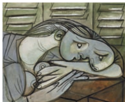
PABLO PICASSO Dormeuse aux persiennes Juan-les-Pins, 25 avril 1936 Huile et fusain sur toile 54,5 x 65,2 cm © Succession Picasso 2019 Musée Picasso Paris

En 1935, el embarazo de Marie-Thérèse precipita la separación de Picasso y su entonces esposa Olga Khokhlova. Picasso se instala en Juan-les-Pins con Marie-Thérèse y su hija Maya, y posteriormente en Le Tremblay-sur-Mauldre, donde pintaría Maya con muñeca (1938). El tumulto vital produce un viraje de la luz afable de Marie-Thérèse, que ennegrece en Durmiente cerca de las persianas (1936). El estallido de la Guerra Civil española (1936-1939) agrava este oscurecimiento: los desastres de la guerra irrumpen en el taller del artista y tiñen la relación con su nueva modelo y amante Dora Maar, fotógrafa surrealista que en 1937 documentaría el proceso de creación del Guernica . La rudeza de los retratos de Maar, como Busto de mujer con sombrero (1941), encierra el dolor goyesco del clima reinante del momento, que se prolongaría durante los horrores de la Segunda Guerra Mundial (1939-1945).