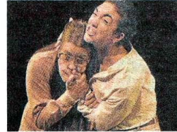
NUEVA. En el San Martín.